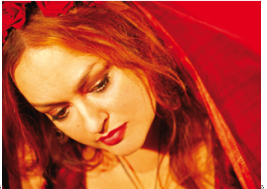
Celle qu'on appelle la « catho rouge » présente pour la première fois à la Fête du TA son spectacle Vermelinho

Samedi 25 juin // 15h30 à 16h30 // Chapiteau