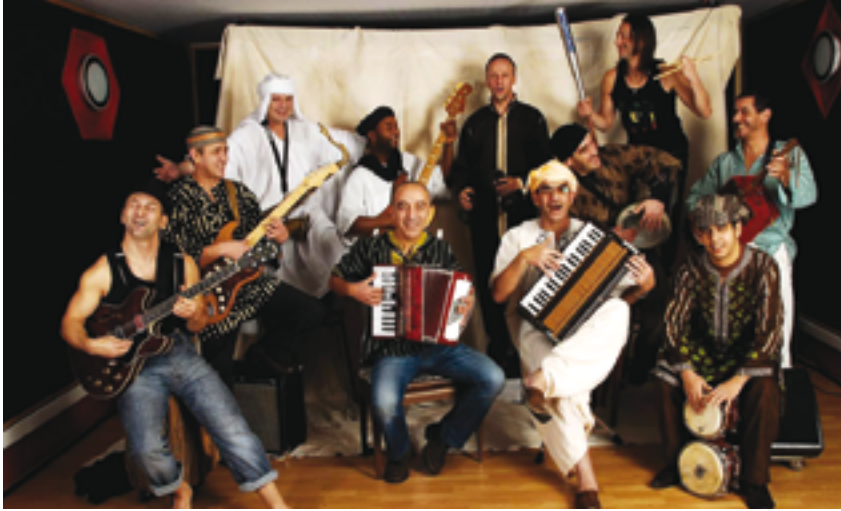
L'Orchestre national de Barbès est assurément un groupe qui ouvre les horizons façon grand large.