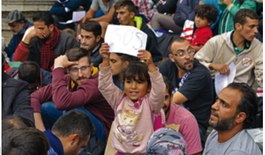
Les réfugiés fuient la guerre, une guerre à laquelle les pays occidentaux ne sont pas étrangers.

Vendredi 24 juin // 19h45 à 20h30 // Grande scène