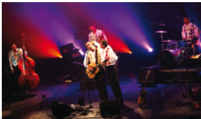
Les enfants et le rire côté rock. Et ça déménage