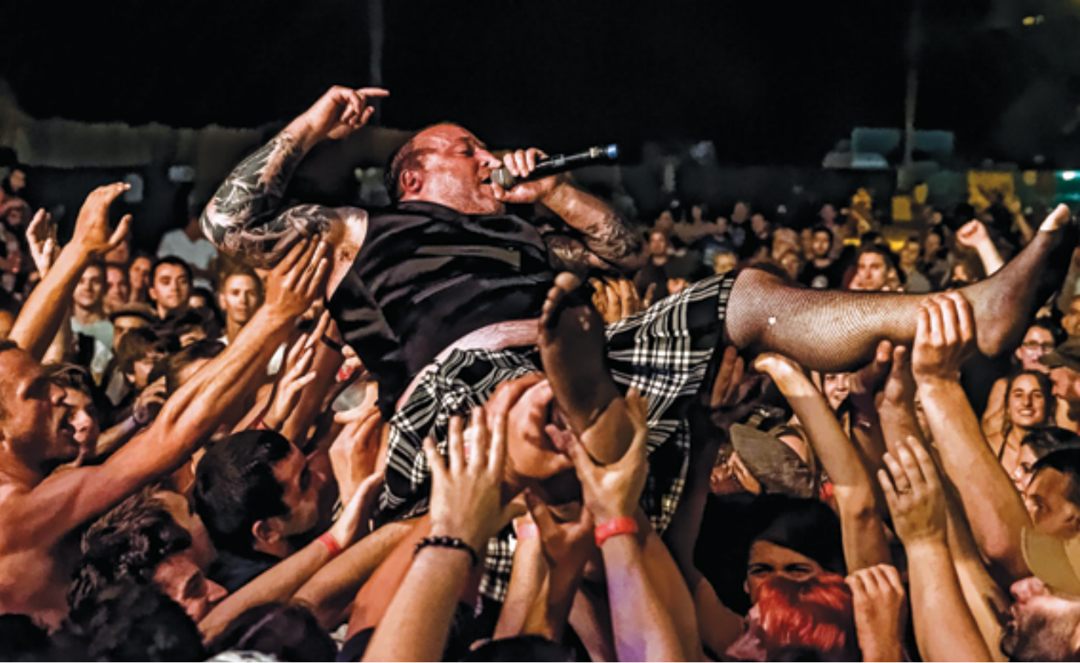
Slobodan d'Opium du Peuple à la fête du Travailleur alpin 2015