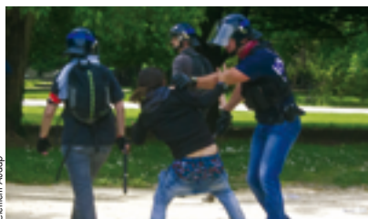
Six mois d'état d'urgence et ça continue.

Dimanche 26 juin // 11h à 12h30 // Espace débat.