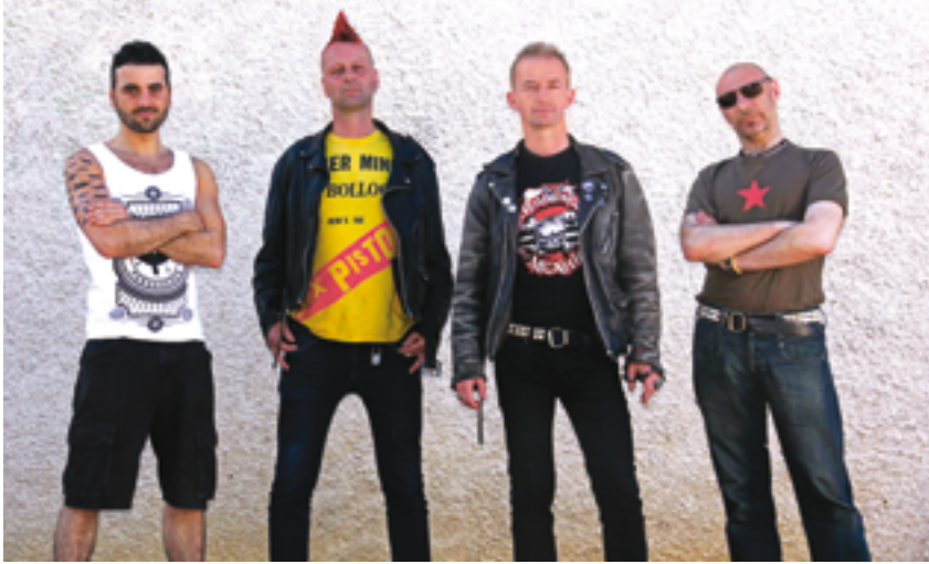
Du punk qui envoie. Mais ça vaut le coup de tendre l'oreille pour écouter les textes.