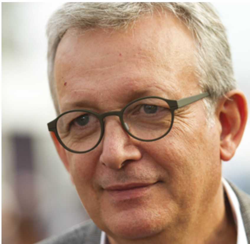
Samedi 25 juin, Pierre Laurent, secrétaire national du PCF, sera sur la fête du TA à partir de 11 heures.

Samedi 25 juin // 16h // Espace débat Voir également page 12 de ce numéro.